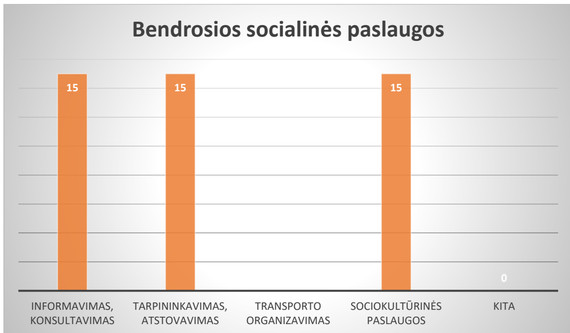
Lentelė Nr.1. Bendrosios socialinės paslaugos ir jas gaunančių asmenų skaičius

Anoniminėje apklausoje apklausta 15 asmenų, gaunančių akredituotas vaikų dienos centro paslaugas.