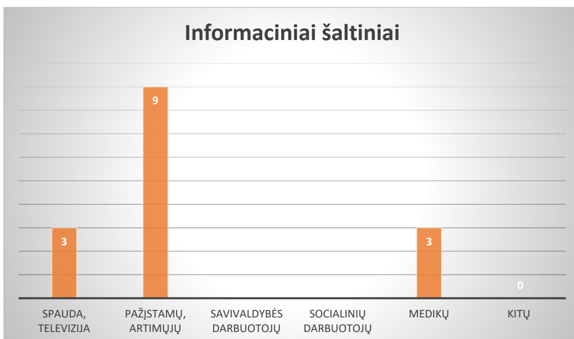
Lentelė Nr.4. Šaltiniai, iš kurių asmenys sužinojo apie teikiamas paslaugas